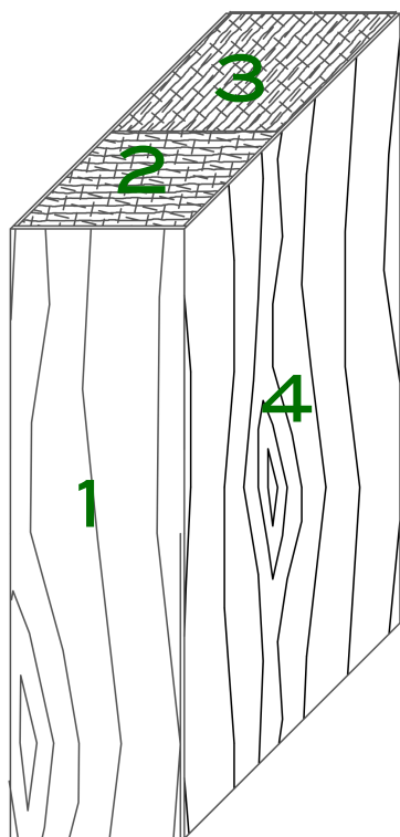
Construcción de 3 Capas